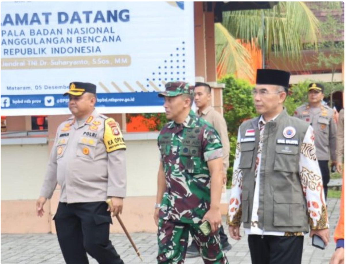
Kapolresta Mataram (Kiri) saat menghadiri acara Peletakan batu Pertama pembangunan gedung Pusdalops BPBD NTB, Kamis (05/12/2024)